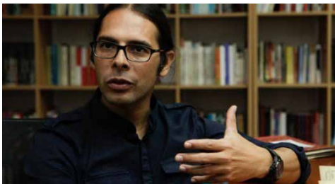
Freddy Nández, Ministro de Cultura de Venezuela

Nández destacó que de los más de 11 millones de libros, un millón de ellos fueron los ejemplares de Don Quijote de la Mancha , de Miguel de Cervantes, distribuidos en el año 2005 de manera gratuita en todas las plazas Bolívar del país, en un acto sin precedentes en la historia editorial de la nación. Igualmente fueron distribuidos gratuitamente 500.000 ejemplares de Los Miserables , la obra máxima del escritor francés Victor Hugo.