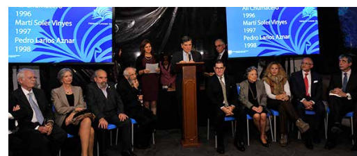
Homenaje a los decanos de la industria editorial en 2015.